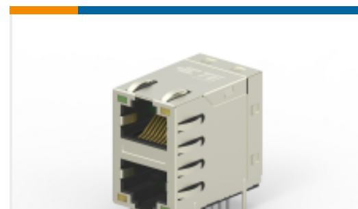
TE 产品编号2301997-9 RJ45 JACK INT.MAG. 10/100 LED 2X1