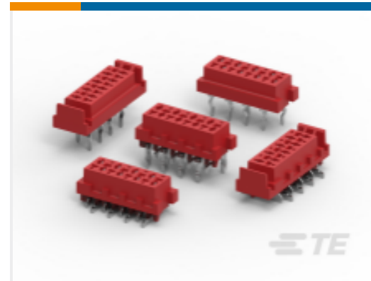
TE 产品编号7-338069-8 Female-on-Board Connector, Top Entry