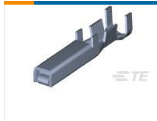
TE 产品编号1-175218-3 DYNAMIC D-3 REC CONT. L AU 0.76 L /P