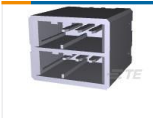
TE 产品编号1-178141-2 DYNAMIC CONN 6P V HDR ASSY