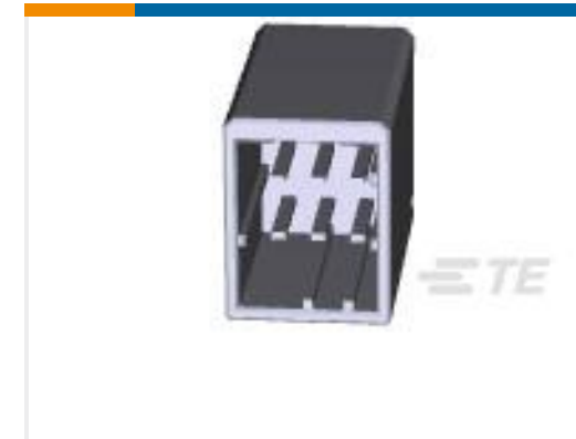
TE 产品编号1318124-1 DYNAMIC D2100 HDR V ASSY 6P