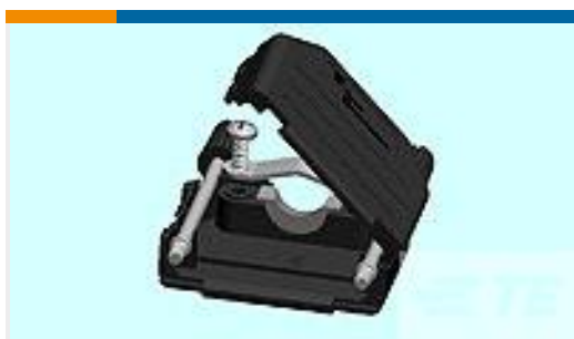
TE 产品编号1-1991253-5 15 WAY LOW COST D SUB BACKSHEL