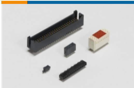
板对板接头和插座(351)