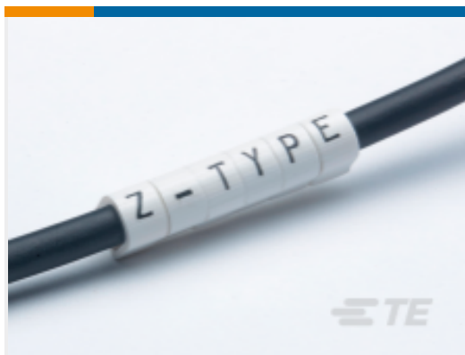
TE 产品编号EC0077-000 05801937