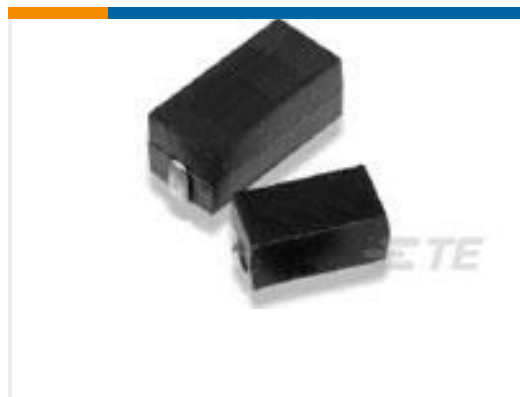
TE 产品编号7-1676966-5 SMW2 120R 5%