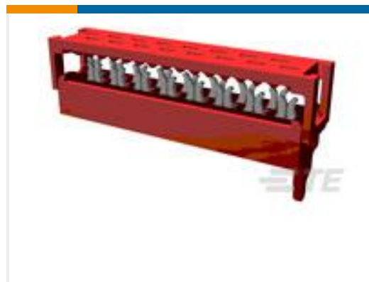
TE 产品编号1-215083-0 MICRO-MATCH MOW.10P