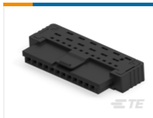
TE 产品编号234487-E SRCA 1,27 12 F 1 I2426 137 E1 094 1,07 T