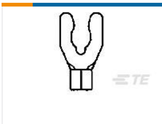
TE 产品编号53833-1 SOLIS SPR SPADE 16-14 8