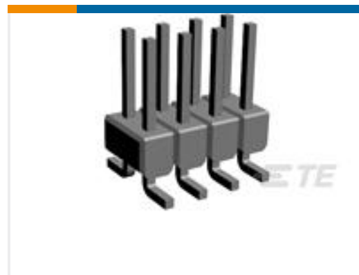
TE 产品编号1241050-4 2x4P MOD II BREAK AWAY HDR,SMD, BLISTER