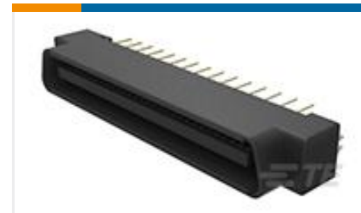
TE 产品编号1734100-3 Champ050 series, 30pos, Au over PdNi