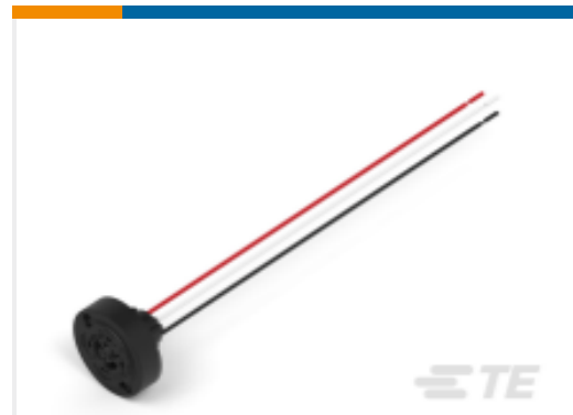
TE 产品编号6-2213362-2 RCPT ASSY, DIMMABLE PHOTOCONTROL, 150C, 3 P