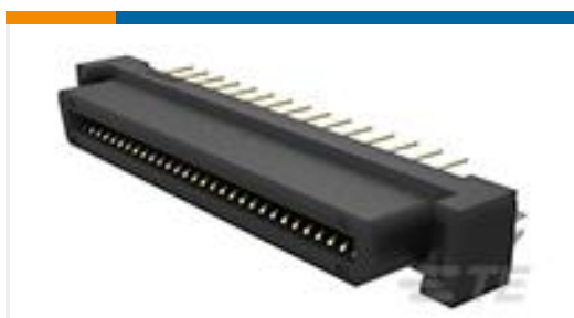
TE 产品编号1734101-3 Champ050 series, 30pos, Au over PdNi