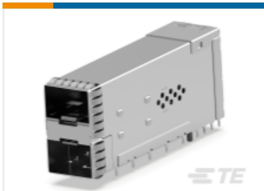
TE 产品编号2349202-5 SFP56 STACKED 2X1 RECEPTACLE ASSEMBLY