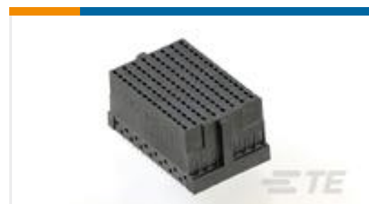
TE 产品编号1934949-1 Tinman 5pr 8col vert recpt 15mm stack