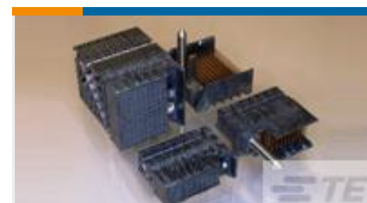
TE 产品编号2007808-2 IMP100S, H, V4P10C, LG, OEW46, 4.9