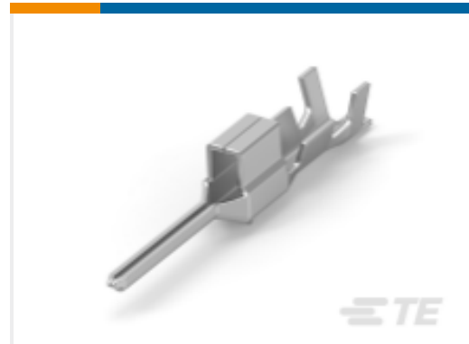
TE 产品编号2232575-1 2.5 SIGNAL D/LOCK TAB CONT. M