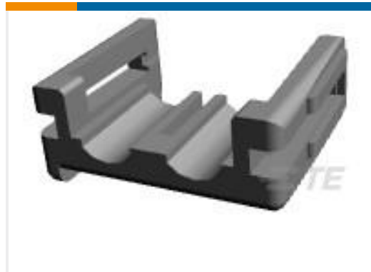
TE 产品编号1565089-1 GRACE INERTIA CONNECTOR 3.5 2P