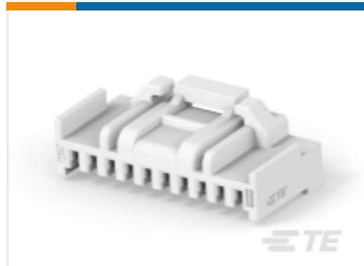
TE 产品编号1-2371404-0 SGI 1.25 Plug HSG, 10P, Key A, Natural