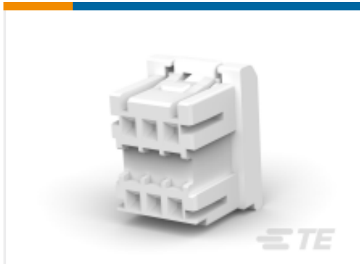
TE 产品编号2134905-1 GIC 2.5W PLUG HSG 6P NATURAL