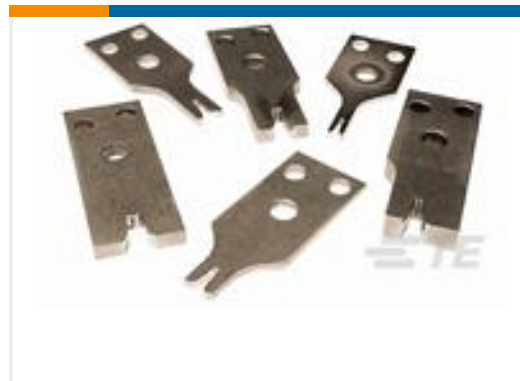
TE 产品编号2047141-1 Wire Crimper, MISC F