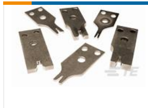
TE 产品编号3-1729698-1 CRIMPER, WIRE (HD-C APPL, TERMINAL 16742