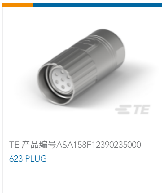
TE 产品编号ASA158F12390235000 623 PLUG