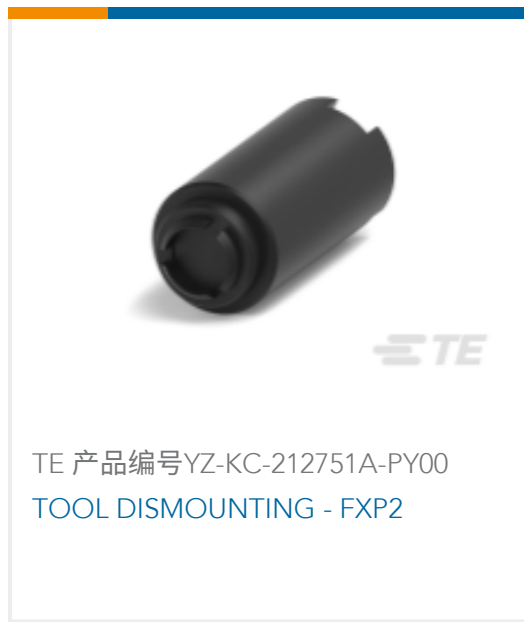
TE 产品编号YZ-KC-212751A-PY00 TOOL DISMOUNTING - FXP2