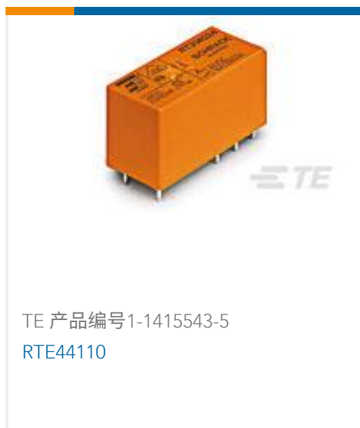
TE 产品编号1-1415543-5 RTE44110