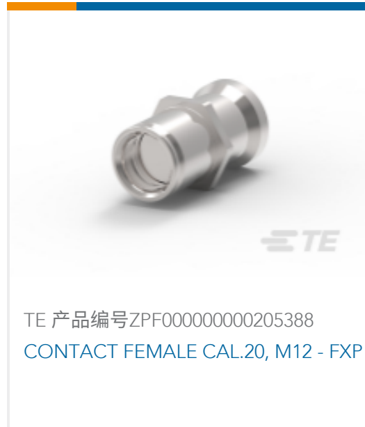
TE 产品编号ZPF000000000205388 CONTACT FEMALE CAL.20, M12 - FXP