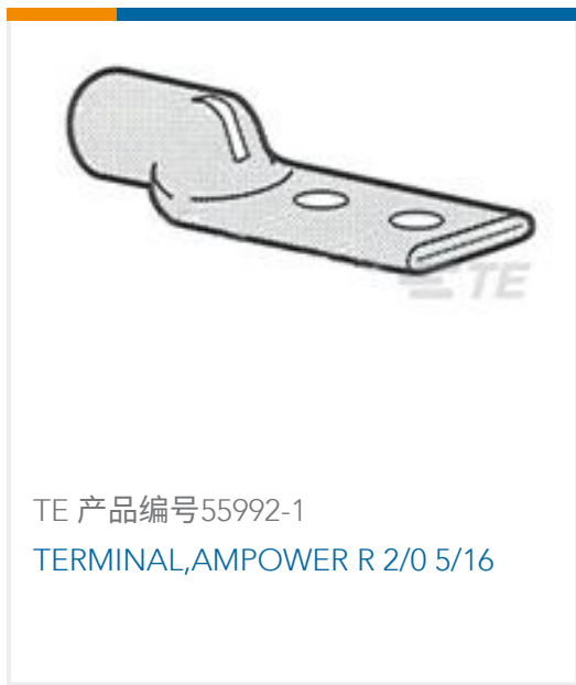
TE 产品编号55992-1 TERMINAL,AMPOWER R 2/0 5/16