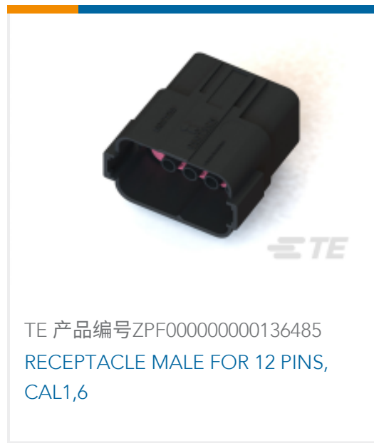
TE 产品编号ZPF000000000136485 RECEPTACLE MALE FOR 12 PINS, CAL1,6