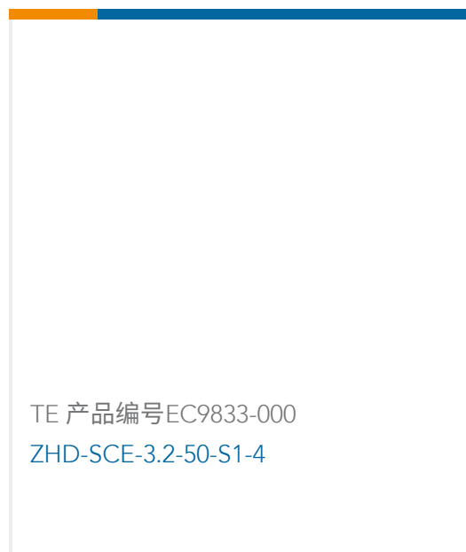
TE 产品编号EC9833-000 ZHD-SCE-3.2-50-S1-4