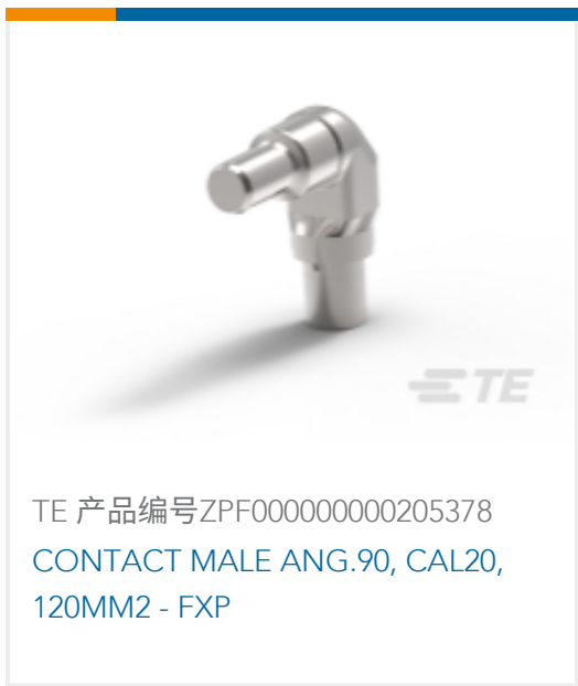
TE 产品编号ZPF000000000205378 CONTACT MALE ANG.90, CAL20, 120MM2 - FXP