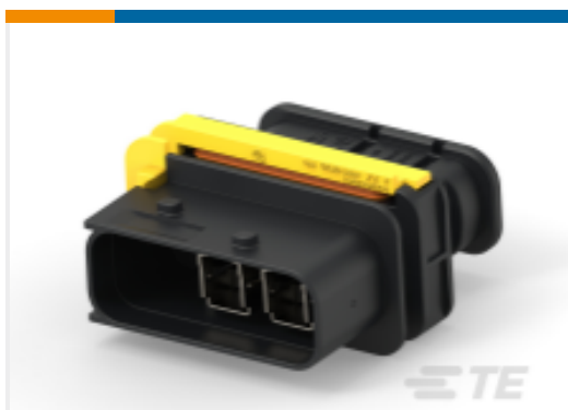
TE 产品编号9-2348782-1 HD MATEnet 2+6 TAB HSG ASSY, GRP E