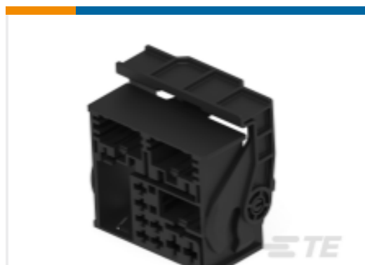
TE 产品编号2278600-3 52POS., MIXED REC. HSG+LEVER, ASS'Y