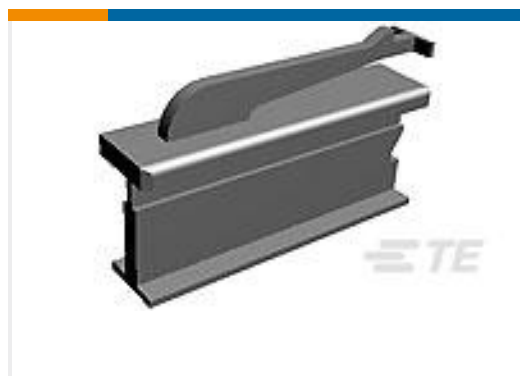
TE 产品编号1355528-2 MPQ 2.KONT-SICHNG8P