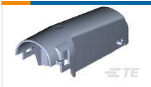
TE 产品编号2112233-1 COVER,90,FOR 46POS