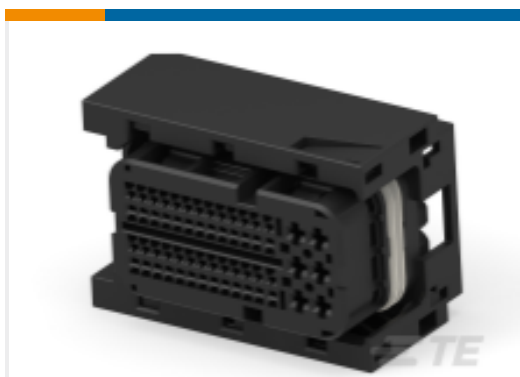
TE 产品编号2-2289748-0 58POS, MIXED, REC HSG, ASSY