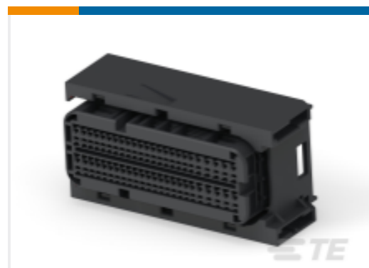
TE 产品编号8-1564284-5 96POS, MCON-1.2 CB, REC HSG, ASSY