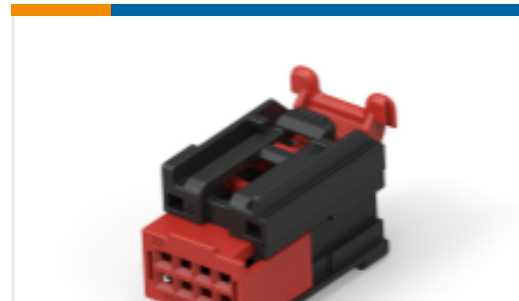
TE 产品编号1456987-1 2x4 Fem unsealed LP assy Key A