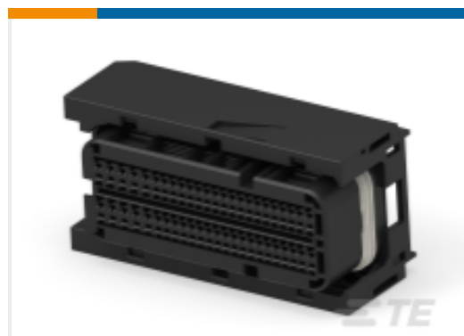
TE 产品编号2359943-2 96POS, MCON-1.2 CB, REC HSG, ASSY