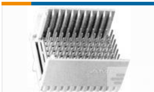
TE 产品编号5646884-1 2MMHM TYPE A/B 125 POS INVERSE