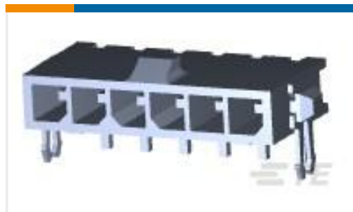
TE 产品编号2-1445097-6 MICRO MNL HDR ASSY S/ROW AU LF