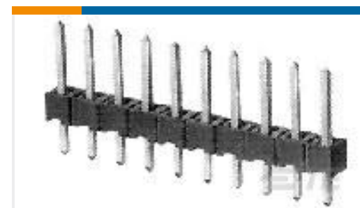
TE 产品编号826629-4 4P AMPMODU II PIN HSG