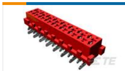
TE 产品编号7-188275-6 MICRO-MATCH SMD FTE