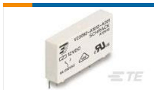
TE 产品编号2-1393236-4 V23092-A1024-A301