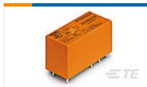
TE 产品编号3-1393240-5 RT33L024