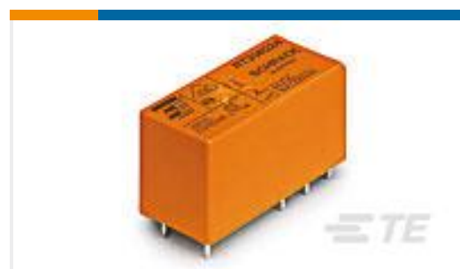
TE 产品编号6-1393243-8 RT424024