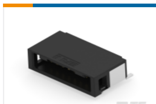
TE 产品编号504285-E MCBA 8 M * SMD 137 * 176 * GURT * J 2 50