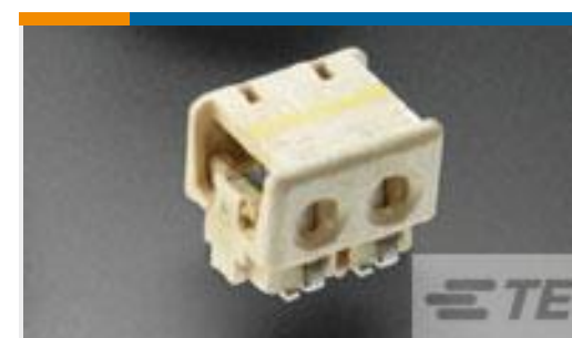
TE 产品编号2106431-2 Connector, SMT-IDC PASS THRU, 2 POS, 18