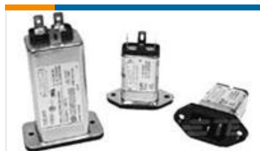
TE 产品编号6609064-1 1EOP M0=F7687A