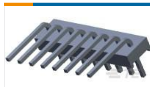
TE 产品编号640453-8 08P MTA100 HDR ASSY SQ R/A