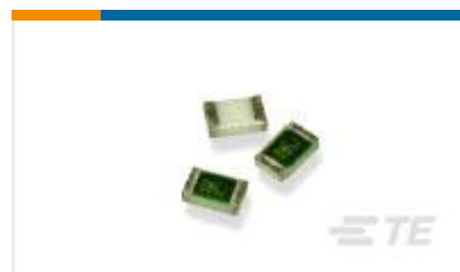
TE 产品编号9-1879208-2 CPF 0402 62K 0.1% 25PPM 1K RL