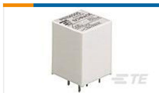
TE 产品编号9-1415029-1 PB114024