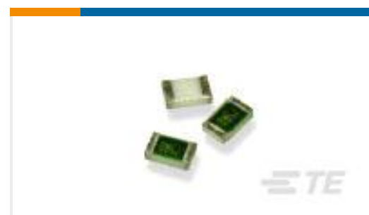
TE 产品编号8-1879215-0 CPF 0402 30K9 0.1% 25PPM 1K RL