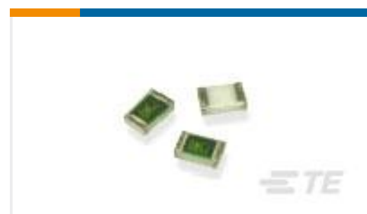
TE 产品编号1676371-2 RN 0805 53K6 0.1% 10PPM 1KRL