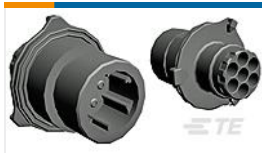
TE 产品编号1718230-1 1,5MM PIN HSG 5-7 POS ASSY