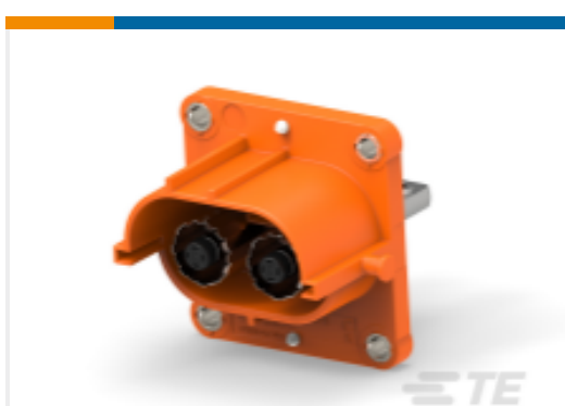
TE 产品编号2-2141227-1 2POS,PIN DIA 8.0,PIN HSG,ASSY,SLD