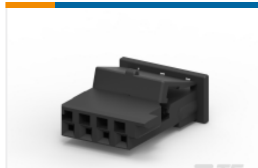
TE 产品编号1-1355397-3 4POS MQS REC COD A