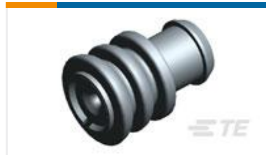
TE 产品编号828904-1 SINGLE WIRE SEAL FOR J.P.T.CON