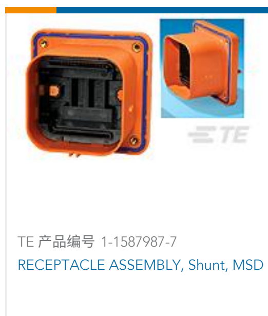
TE 产品编号 1-1587987-7 RECEPTACLE ASSEMBLY, Shunt, MSD