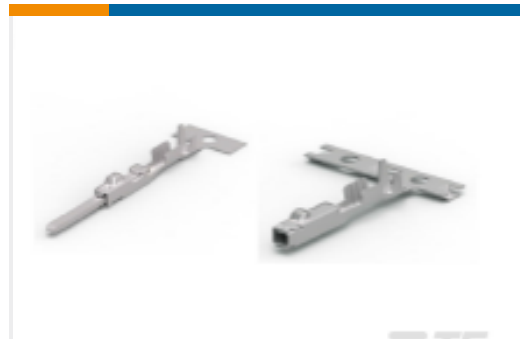
TE 产品编号1452503-1 MCON Receptacle and Tab