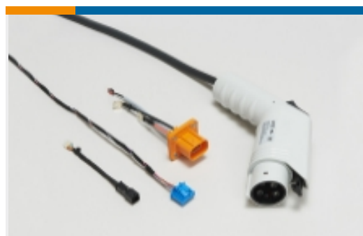
电动、混合动力和燃料电池线束(21)