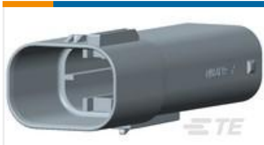
TE 产品编号 2103169-6 OUTER HOUSING, CAP, KEY F, HVA280-2PHM