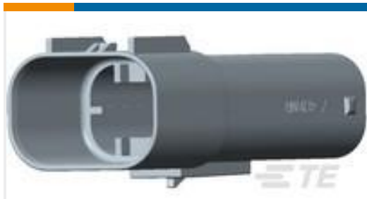
TE 产品编号 2103169-2 OUTER HOUSING, CAP, KEY B, HVA280-2PHM