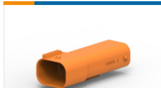
TE 产品编号 2103169-5 OUTER HOUSING, CAP, KEY E, HVA280-2PHM