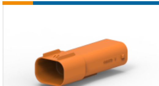
TE 产品编号 2103169-1 OUTER HOUSING, CAP, KEY A, HVA280-2PHM