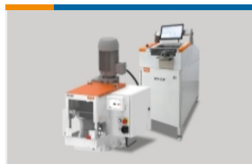
高压线束加工设备(7)