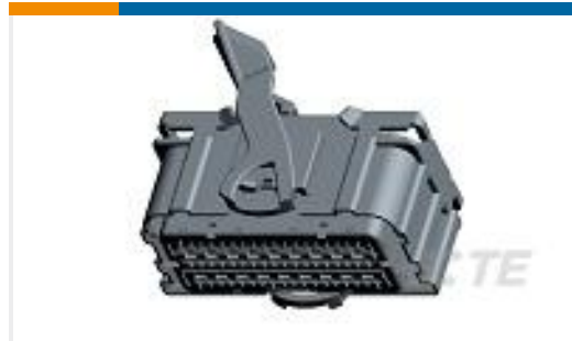
TE 产品编号4-2098922-3 SDM,54P PLUG ASY,RHL,KEY B