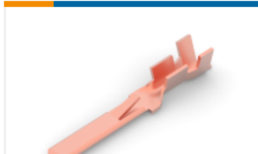
TE 产品编号881719-4 .110 S FASTIN-ON TA