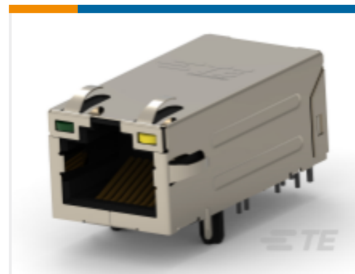
TE 产品编号5-2337992-5 RJ45 JACK MAG. POE 1GB LED 1X1 INV.