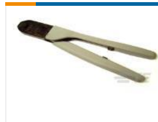
TE 产品编号91547-1 CCII 53 SERIES TAPER PIN 24-22 ASSY INV.