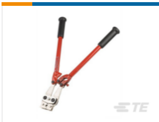
TE 产品编号HDT-04-10 CRIMP TOOL, HDT-04-10