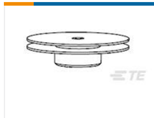
TE 产品编号9-1542004-4 HTS549-U=31MM HS ASSY ULTEM CL