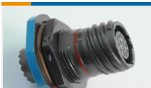
TE 产品编号YDTS24W25-24SNC001 RECP ASSY