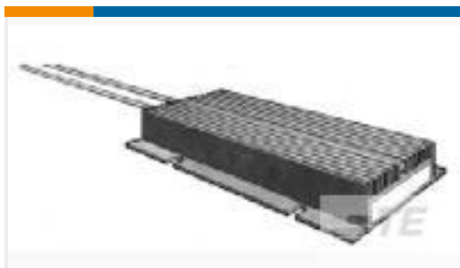
TE 产品编号1623821-8 CFH 1100 680R 5% 300mm Leads