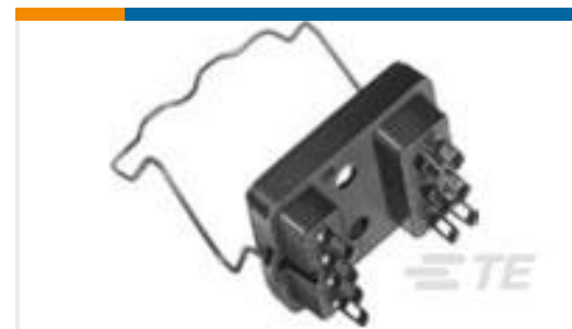
TE 产品编号1393824-8 V23154Z1015