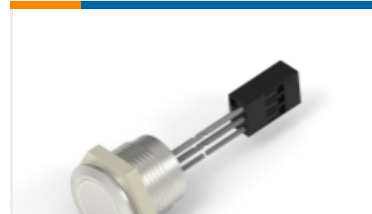
TE 产品编号2342832-4 AVC16L FLAT S04 RED R 500MM/2X3