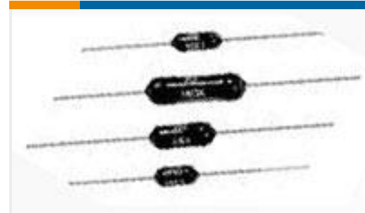
TE 产品编号6-1879655-2 H8 21K5 0.5% 100PPM