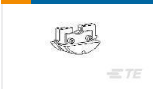
TE 产品编号1752680-4 HYP10 SOLIS FLAG 1/0AWG NEST