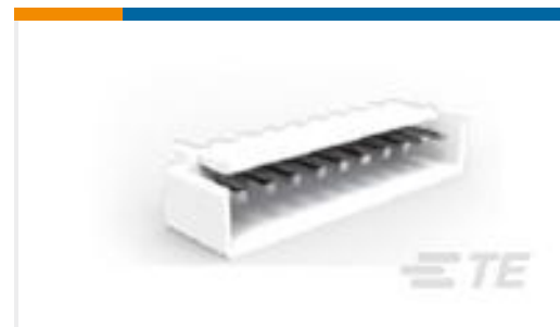
TE 产品编号1-1744427-0 EP Header Assy, Shrouded, 10 Pos, GW