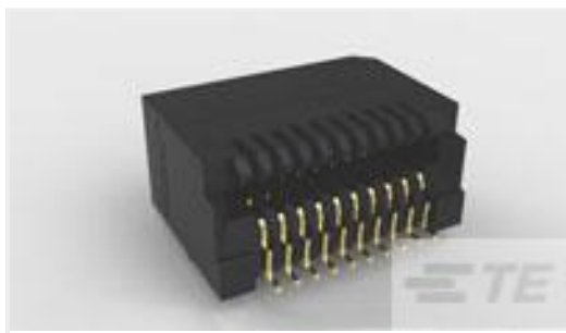
TE 产品编号1888247-1 20 POS SMT CONN, SFP/SFP+, 30A