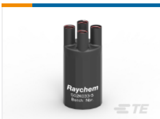
TE 产品编号E00553N001 502K033/S(S15)