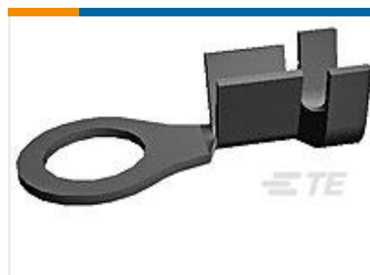
TE 产品编号170225-1 RING TERMINAL