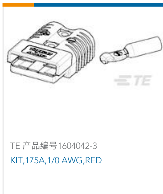
TE 产品编号1604042-3 KIT,175A,1/0 AWG,RED