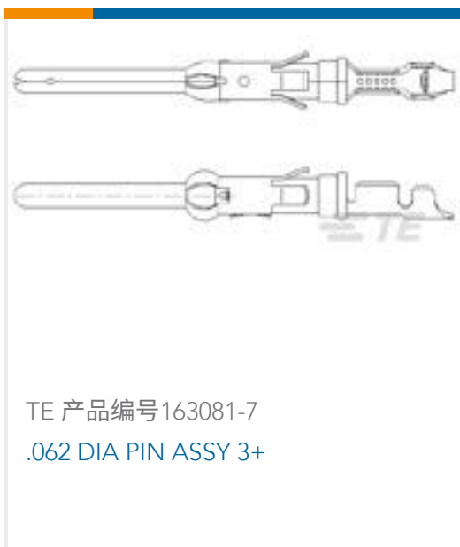
TE 产品编号163081-7 .062 DIA PIN ASSY 3+