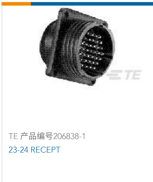
TE 产品编号206838-1 23-24 RECEPT