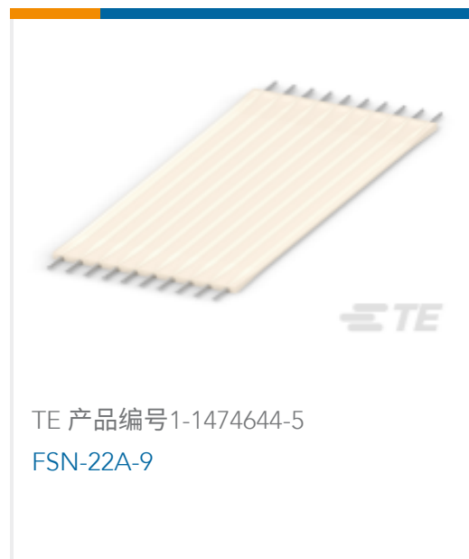
TE 产品编号1-1474644-5 FSN-22A-9