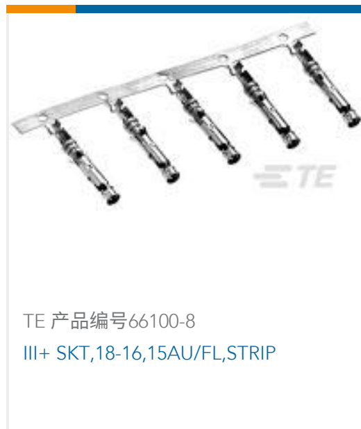
TE 产品编号66100-8 III+ SKT,18-16,15AU/FL,STRIP