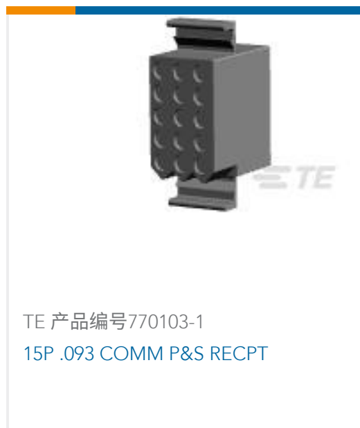
TE 产品编号770103-1 15P .093 COMM P&S RECPT