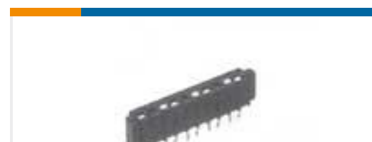
TE 产品编号5-520315-3 TRIOMATE ASSY V 3P L=3.556LDFR