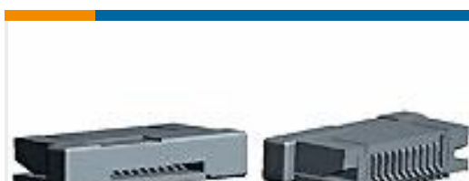
TE 产品编号2-1734592-9 FPC CONN. 0.5MM PITCH B/C, 29P