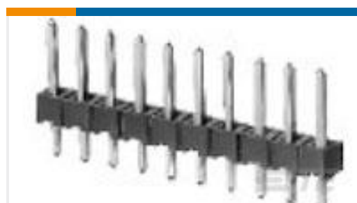
TE 产品编号5-146281-6 06 MODII HDR SRST B/A .100CL