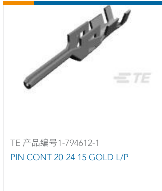
TE 产品编号1-794612-1 PIN CONT 20-24 15 GOLD L/P