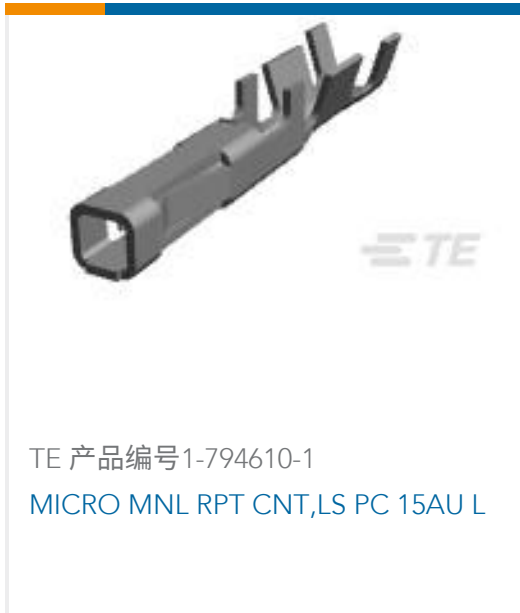
TE 产品编号1-794610-1 MICRO MNL RPT CNT,LS PC 15AU L