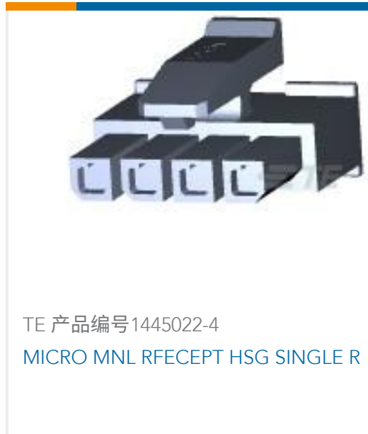
TE 产品编号1445022-4 MICRO MNL RFCEPT HSG SINGLE R