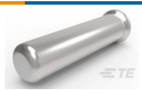
TE 产品编号50865 SOCKET,MIN-SPR AU SER-4