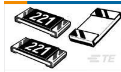
TE 产品编号4-2176230-7 3522 5K6 5% 3W