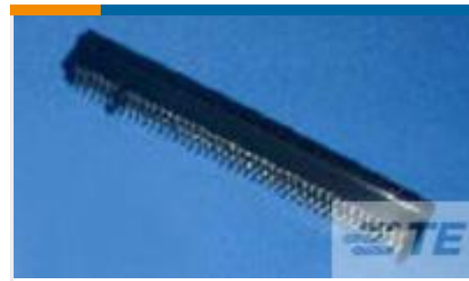
TE 产品编号9-1734774-3 PCI EXP 2.3L 64 POS BLK 30u"