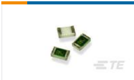
TE 产品编号1-1879208-4 CPF 0402 36R 0.1% 25PPM 1K RL