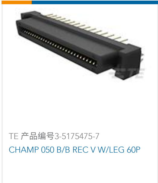
TE 产品编号3-5175475-7 CHAMP 050 B/B REC V W/LEG 60P