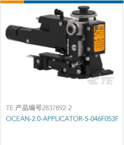
TE 产品编号2837892-2 OCEAN-2.0-APPLICATOR-S-046F053F