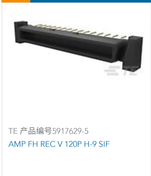
TE 产品编号5917629-5 AMP FH REC V 120P H-9 SIF