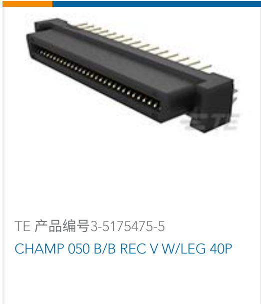
TE 产品编号3-5175475-5 CHAMP 050 B/B REC V W/LEG 40P