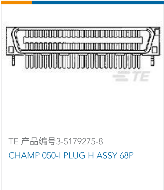
TE 产品编号3-5179275-8 CHAMP 050-I PLUG H ASSY 68P