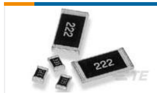
TE 产品编号1622829-1 CRG0603 1% 10K