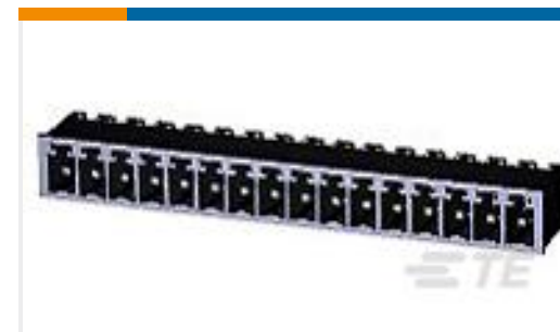
TE 产品编号1-284517-0 10P TERMIBLOK HDR DIR POL