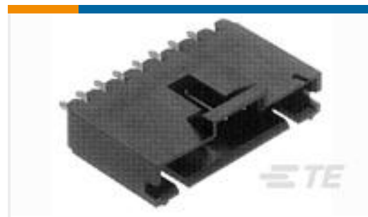
TE 产品编号103670-2 03 MTE HDR SRST LATCH W/HLDWN