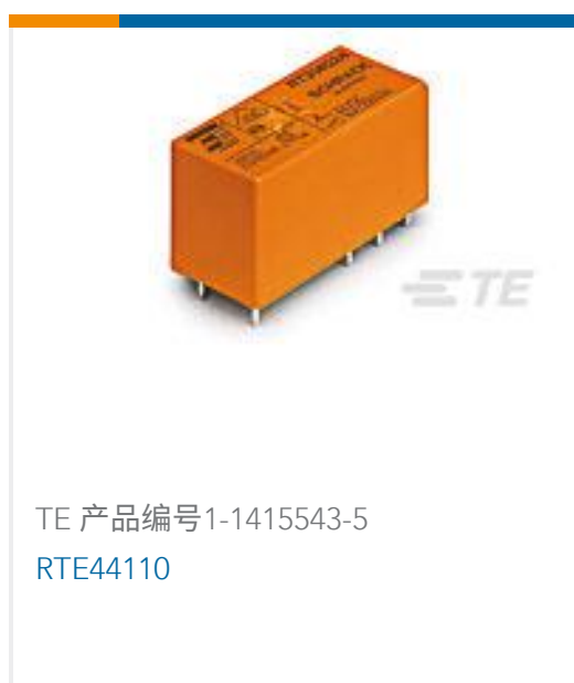
TE 产品编号1-1415543-5 RTE44110