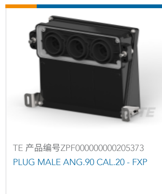
TE 产品编号ZPF000000000205373 PLUG MALE ANG.90 CAL.20 - FXP