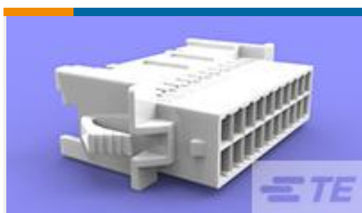
TE 产品编号 1969595-8 HSG,REC,FREE-HANGING,GWT, DUALROW,EP2.5