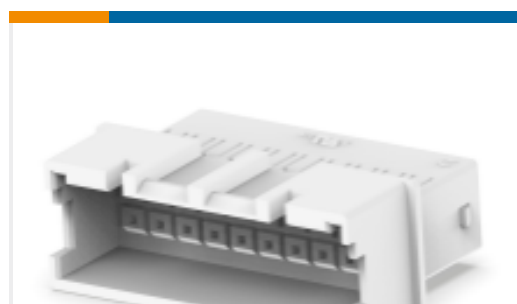
TE 产品编号 1-2324201-8 HSG,REC,FREE-HANGING,GWT, DUALROW,EP2.5