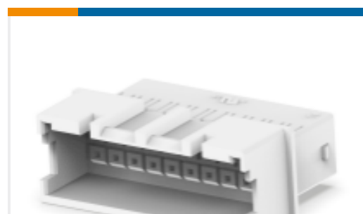
TE 产品编号 1-2324582-8 HSG,REC,FREE-HANGING,DUALROW, EP2.5