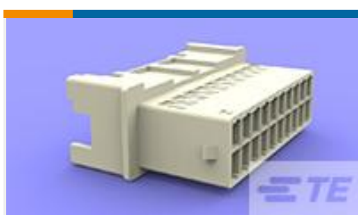
TE 产品编号 1969592-8 HSG,REC,FREE-HANGING,DUALROW,EP2.5