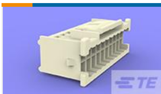
TE 产品编号1-1969540-0 HOUSING, PLUG, 10P, DUAL ROW, EP2.5