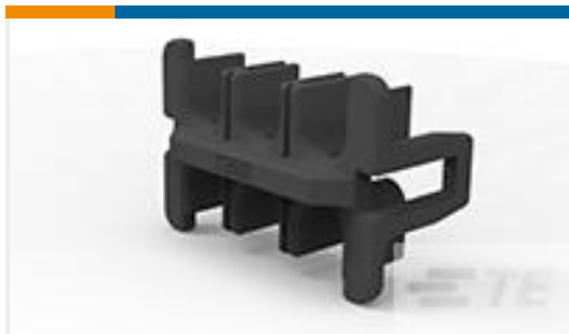
TE 产品编号1971778-3 PTL TPA HIGH TEMP 2 x 3 BLACK