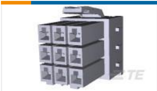
TE 产品编号177903-1 POWER DBL LOCK PLUG HSG 9P