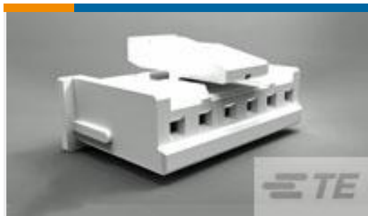
TE 产品编号1-1969442-1 EP 2.5 TPA Housing, 11 Pos