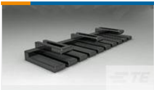
TE 产品编号1969443-2 EP 2.5 TPA Retainer, 2 Pos