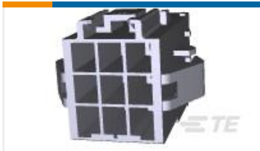
TE 产品编号177911-1 POWER DBL LOCK CAP HSG P/M 9P