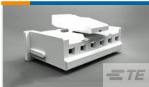
TE 产品编号1969442-4 EP 2.5 TPA Housing, 4 Pos