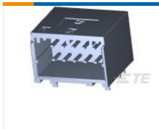
TE 产品编号1-1827876-6 DYNAMIC 1200D HDR ASSY H 12PX BLACK GOLD