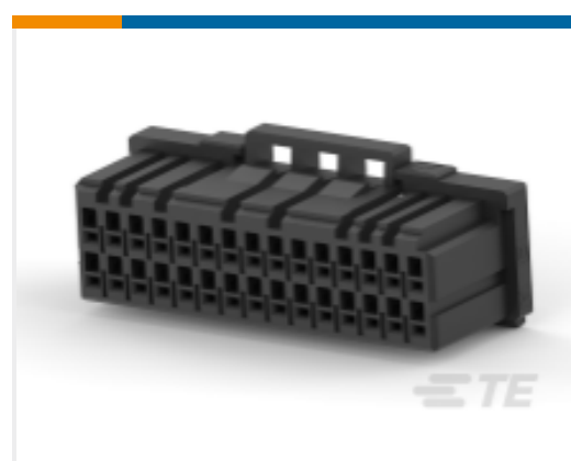
TE 产品编号1-2333134-5 DYNAMIC 1100D REC HSG 30P X BLACK 33%GF