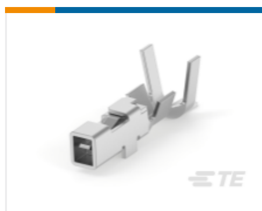
TE 产品编号1827570-2 Contact: Component To Wire; 3-5A, 30-18 Wire Size