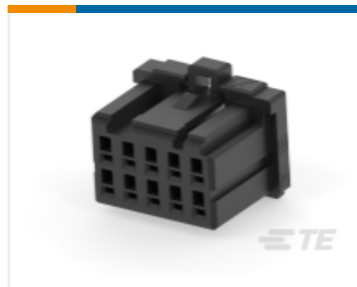
TE 产品编号1-1871465-2 Receptacle and Tab Housing: 2.5 mm Pitch, 250V