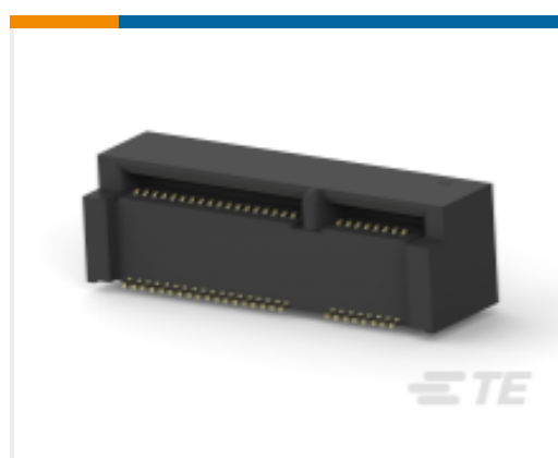
TE 产品编号1759513-1 0.8MM MINI PCI EXPRESS CONNECTOR 9H