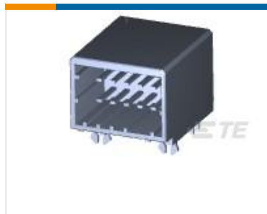
TE 产品编号1376020-2 DYNAMIC D2100 HDR H ASSY 12P Y