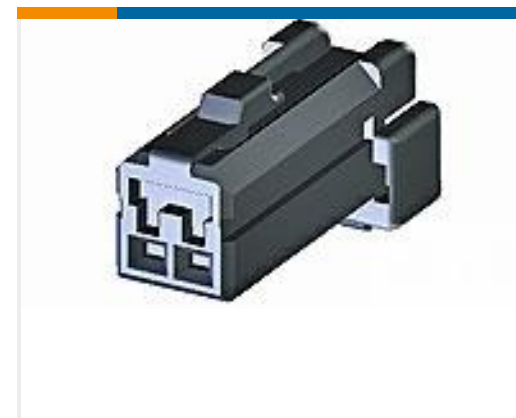
TE 产品编号174056-2 040 MULTILOCK PLUG 2P