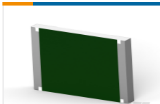
TE 产品编号2176406-9 3560 2R2 1%