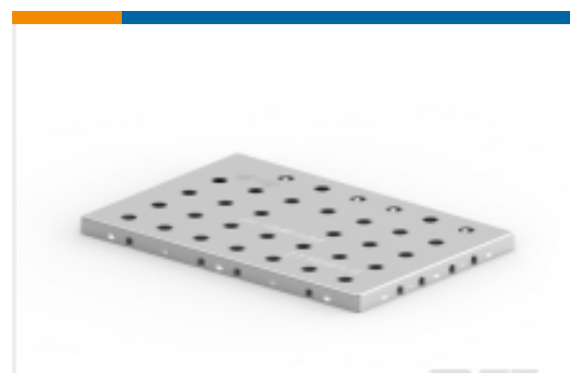
TE 产品编号2118721-4 STD SHIELD COVER, AL-38.60X25.90X2.00MM