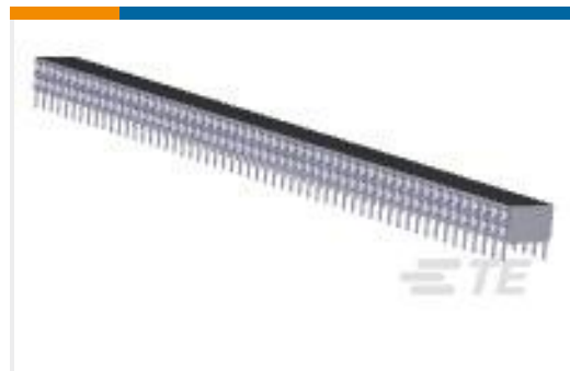
TE 产品编号5-535512-2 112 MODII HORZ DR CE EESS .100