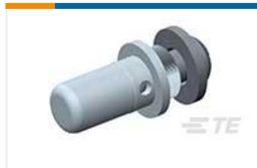
TE 产品编号2085958-1 ICCON,SIZE 4,LOCKING PIN ASSEMBLY