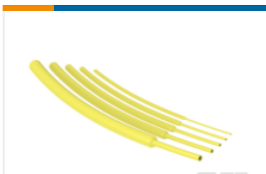
TE 产品编号NB18922001 RNF-100-1/16-YO-STK