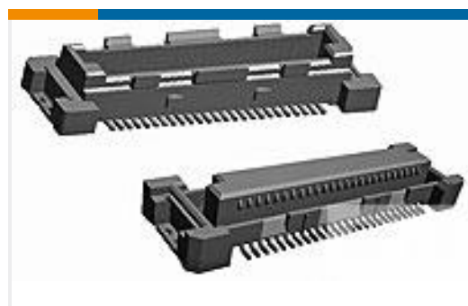
TE 产品编号1-5353729-0 .6FHR04H,280,B,GIG,08/Sn,ST,NSYes