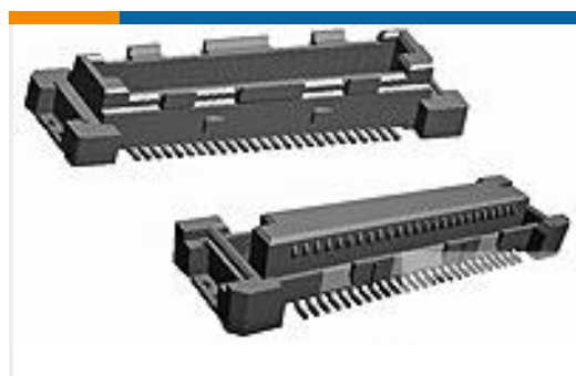
TE 产品编号1-5353727-0 .6FHP08H,280,B,GIG,08/Sn,ST,NSYes