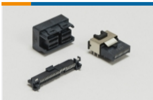
SAS 和 MiniSAS(30)