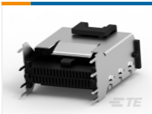
TE 产品编号 1888863-4 Shld Vert Rec Conn Assm36PosSF