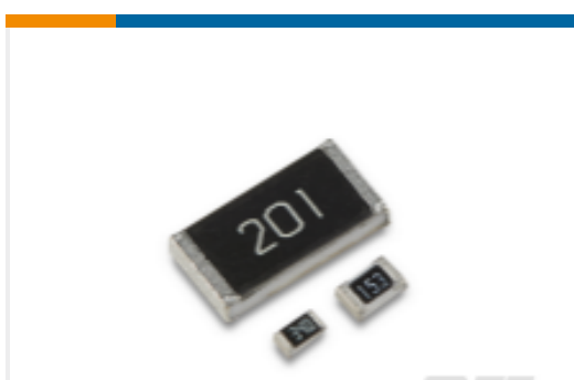
TE 产品编号2176328-3 CRGP 1206 15R 1%