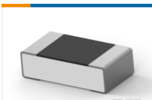
TE 产品编号1-2176372-6 RQ 0603 71K5 0.1% 10PPM 5K RL