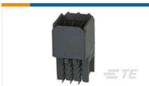
TE 产品编号5-5223961-1 TE UPM R/A Header 3P HC Power, LLL