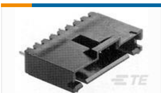
TE 产品编号5-104362-9 10 MTE HDR SRST LATCH W/HLDWN