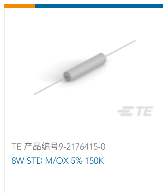
TE 产品编号 9-2176415-0 8W STD M/OX 5% 150K