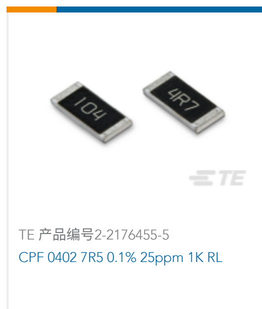
TE 产品编号 2-2176455-5 CPF 0402 7R5 0.1% 25ppm 1K RL