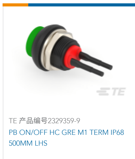
TE 产品编号 2329359-9 PB ON/OFF HC GRE M1 TERM IP68 500MM LHS