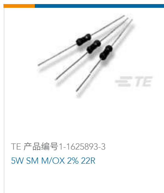
TE 产品编号 1-1625893-3 5W SM M/OX 2% 22R