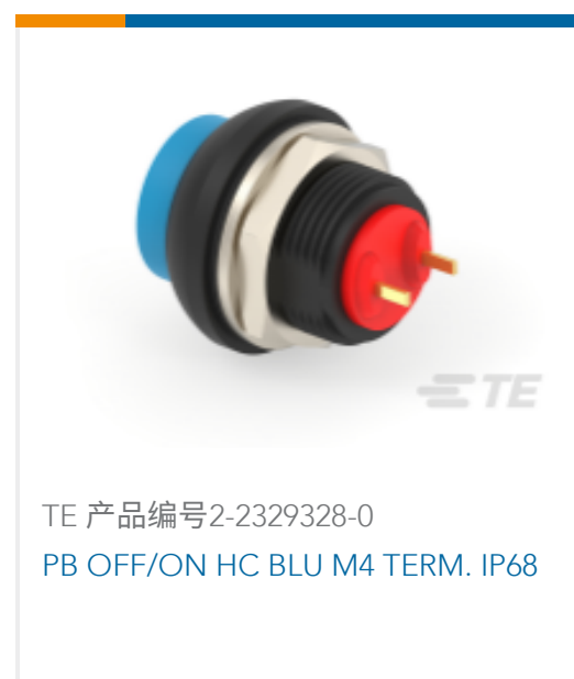
TE 产品编号 2-2329328-0 PB OFF/ON HC BLU M4 TERM. IP68