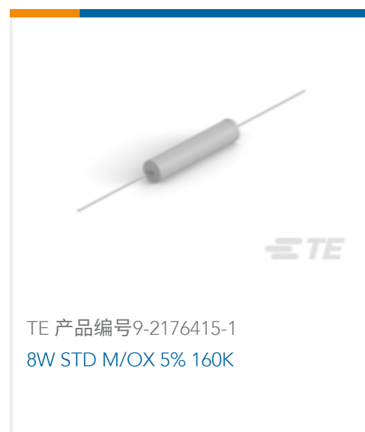
TE 产品编号 9-2176415-1 8W STD M/OX 5% 160K