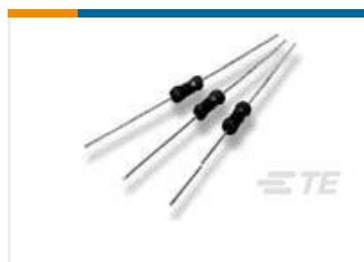
TE 产品编号1-1625893-3 5W SM M/OX 2% 22R