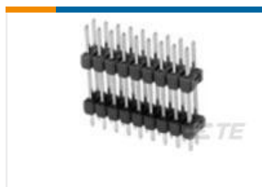
TE 产品编号5-146496-2 04 MODII HDR DRST UNSHRD STKG