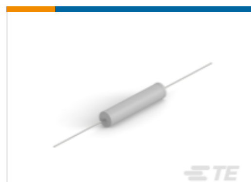
TE 产品编号9-2176415-0 8W STD M/OX 5% 150K