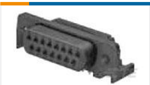
TE 产品编号5745396-2 HD-20 RCPT 15P RA 318 FFSCRLK