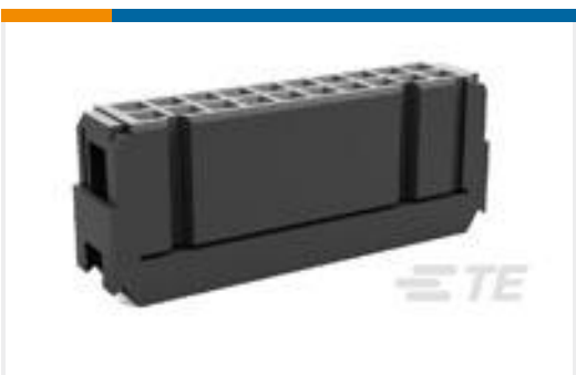
TE 产品编号1658620-5 24 NOVO MIL 15DP, LEAD FREE