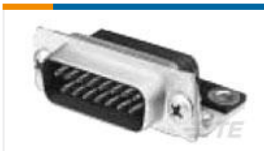
TE 产品编号5745434-8 09 PLUG RA/MS 454