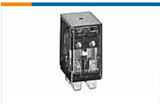
TE 产品编号6-1393144-8 K10P-11D55-24=K10/K20