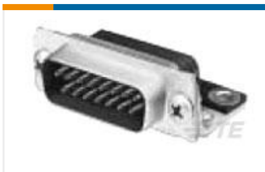
TE 产品编号5745436-3 25 PLUG RA/MS 454