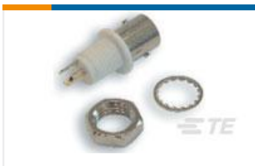
TE 产品编号1-1478201-0 BNC Ins BHSkt 75Ohm Nickel Silver Pltd