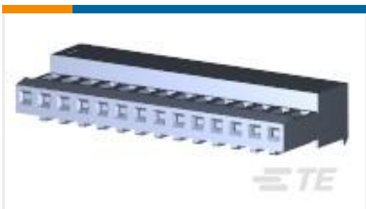
TE 产品编号4-640440-4 14P MTA100 CONN ASSY 22AWG RED