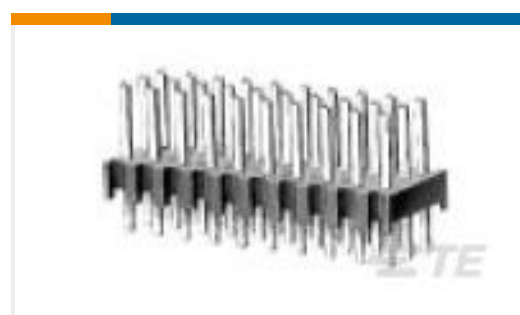
TE 产品编号829492-3 3X 3P MOD2 STIFTEI