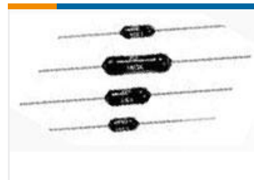
TE 产品编号2-1879642-0 H8 50K 0.1% 10PPM