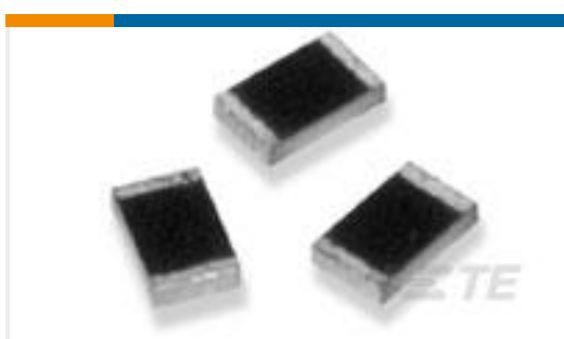
TE 产品编号1879746-1 RP 1J 5K9 0.1% 15PPM CUT LENGTH