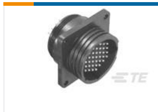
TE 产品编号1-208223-1 CPC RCPT ASSEMBLY SIZE 13-9