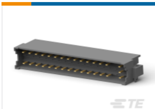
TE 产品编号188753-4 31P.IEC-F MALE CONN