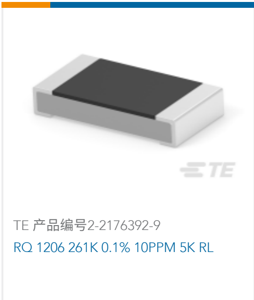
TE 产品编号2-2176392-9 RQ 1206 261K 0.1% 10PPM 5K RL