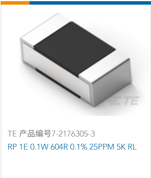
TE 产品编号7-2176305-3 RP 1E 0.1W 604R 0.1% 25PPM 5K RL