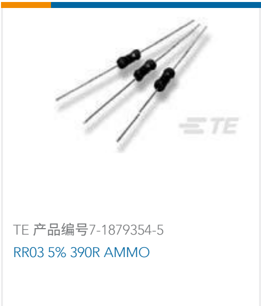
TE 产品编号7-1879354-5 RR03 5% 390R AMMO