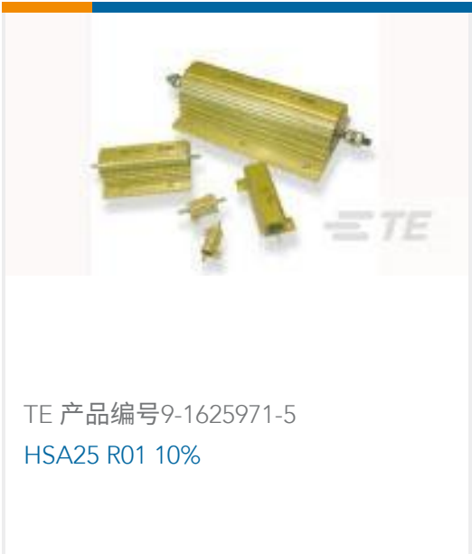
TE 产品编号9-1625971-5 HSA25 R01 10%