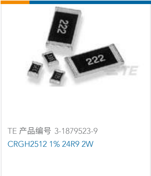
TE 产品编号 3-1879523-9 CRGH2512 1% 24R9 2W