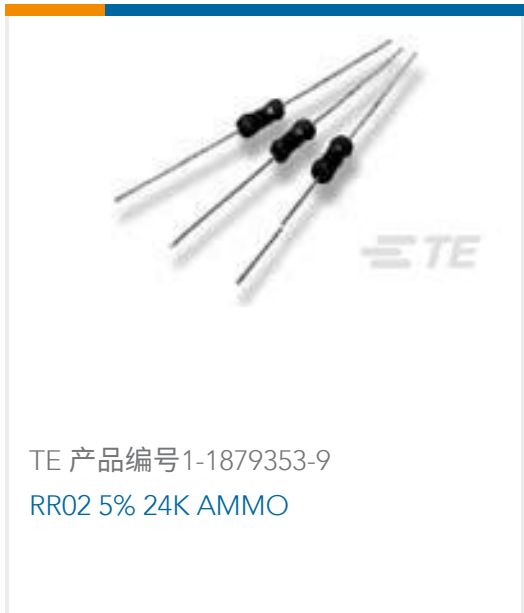
TE 产品编号1-1879353-9 RR02 5% 24K AMMO