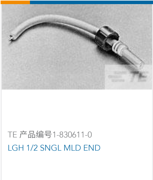
TE 产品编号1-830611-0 LGH 1/2 SNGL MLD END