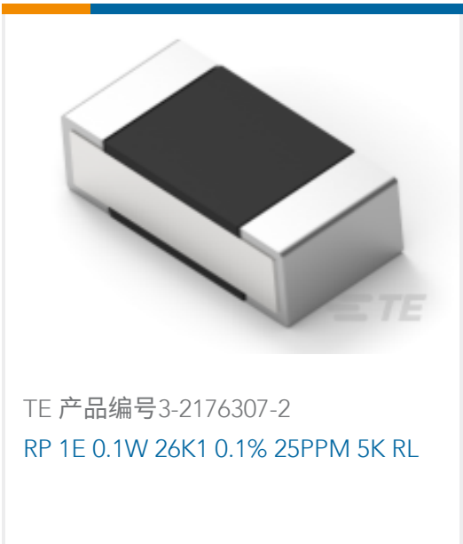
TE 产品编号3-2176307-2 RP 1E 0.1W 26K1 0.1% 25PPM 5K RL