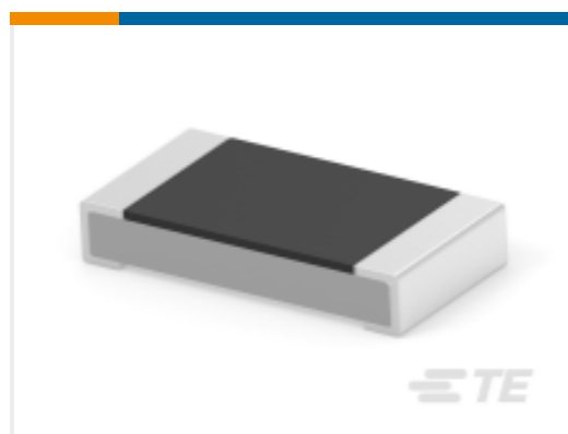
TE 产品编号2-2176392-9 RQ 1206 261K 0.1% 10PPM 5K RL