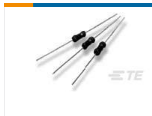
TE 产品编号1-1879353-9 RR02 5% 24K AMMO