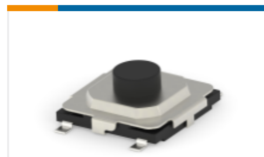
TE 产品编号2337238-3 TACT MINI GW 5.2X5.2X2 160GF