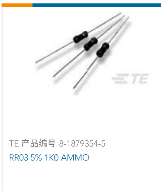
TE 产品编号 8-1879354-5 RR03 5% 1K0 AMMO