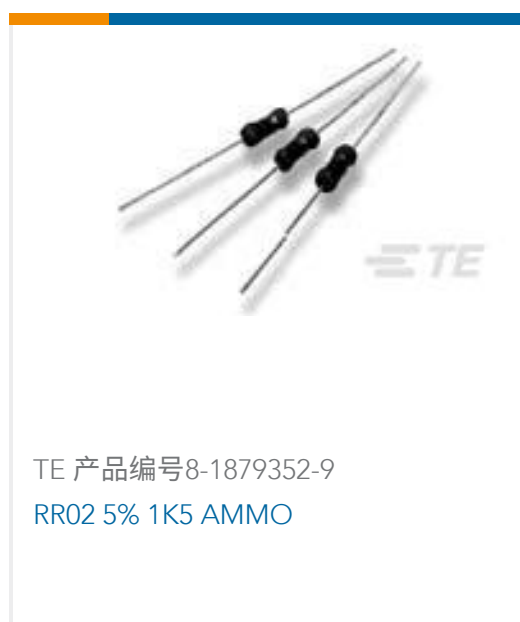
TE 产品编号8-1879352-9 RR02 5% 1K5 AMMO