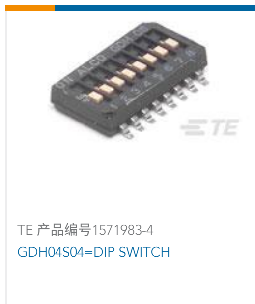
TE 产品编号1571983-4 GDH04S04=DIP SWITCH