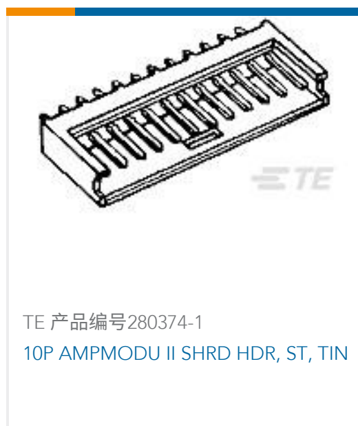
TE 产品编号280374-1 10P AMPMODU II SHRD HDR, ST, TIN