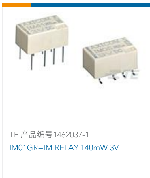
TE 产品编号1462037-1 IM01GR=IM RELAY 140mW 3V