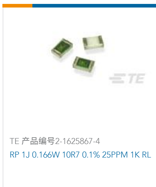
TE 产品编号2-1625867-4 RP 1J 0.166W 10R7 0.1% 25PPM 1K RL