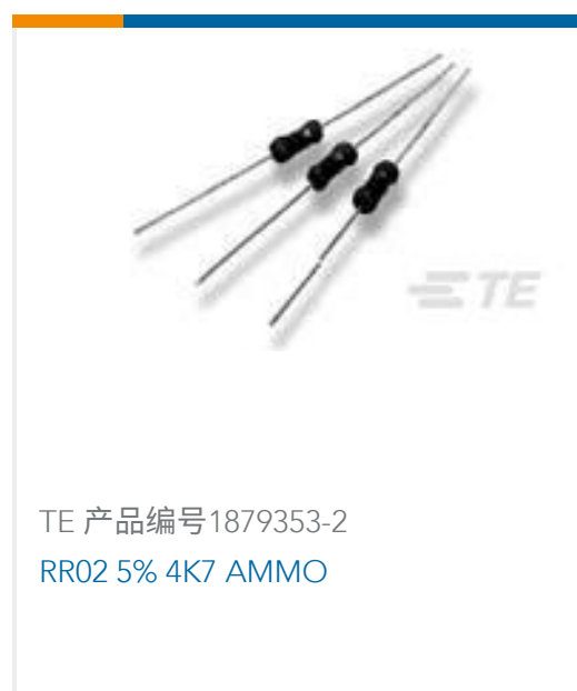
TE 产品编号1879353-2 RR02 5% 4K7 AMMO