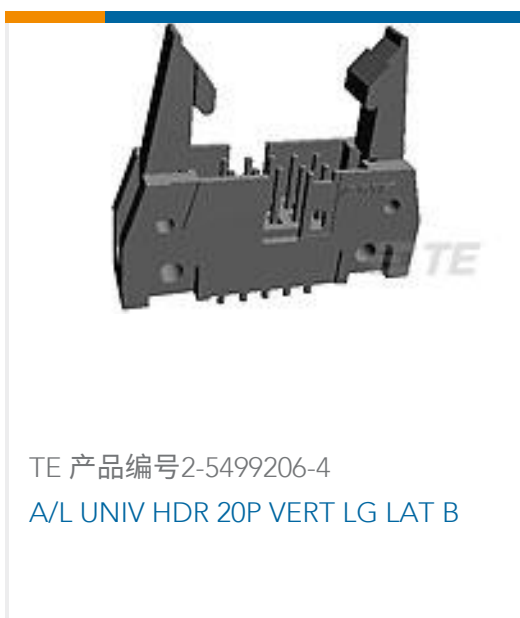
TE 产品编号2-5499206-4 A/L UNIV HDR 20P VERT LG LAT B