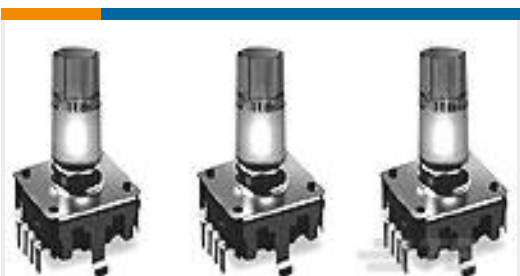
TE 产品编号 4-1879314-5 DPL12S 24P 24DET 25K RD/GRN