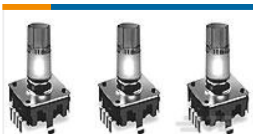
TE 产品编号 1-1879314-1 DPL12 24P NDET 20F BLUE