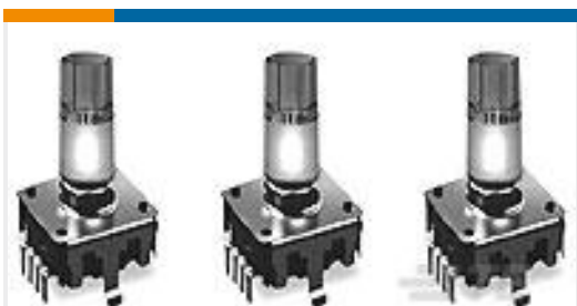
TE 产品编号 4-1879314-7 DPL12S 24P 24DET 21F RD/GRN