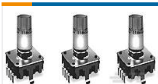
TE 产品编号 2-1879749-3 LED ENCODER 12MM HORIZ SW GR /RD