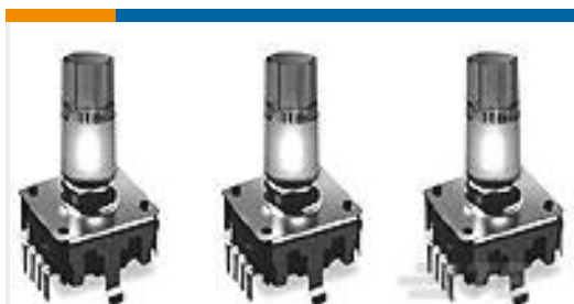
TE 产品编号 1-1879749-7 LED ENCODER 12MM HORIZ SW GR /RD