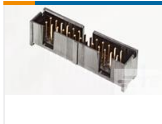
TE 产品编号2-1761603-9 IDC LOW PRO HDR 26P VERT BLUE