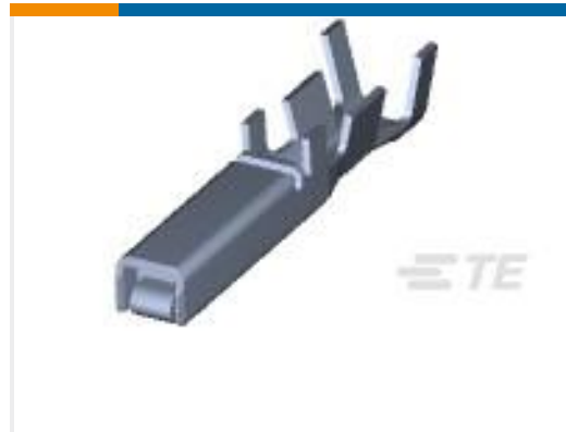
TE 产品编号175196-3 DYNAMIC D-3 REC CONT/L AU 0.76