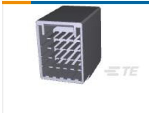
TE 产品编号917251-2 DYNAMIC D-3400F HDR ASSY 20P H