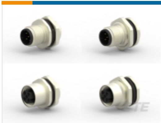
TE 产品编号T4133012051-000 M12 面板安装焊杯