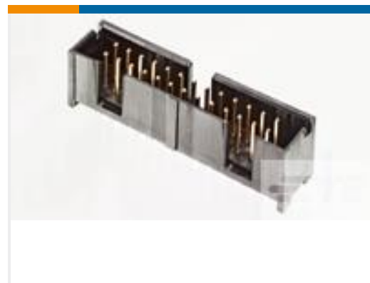
TE 产品编号2-1761603-9 IDC LOW PRO HDR 26P VERT BLUE