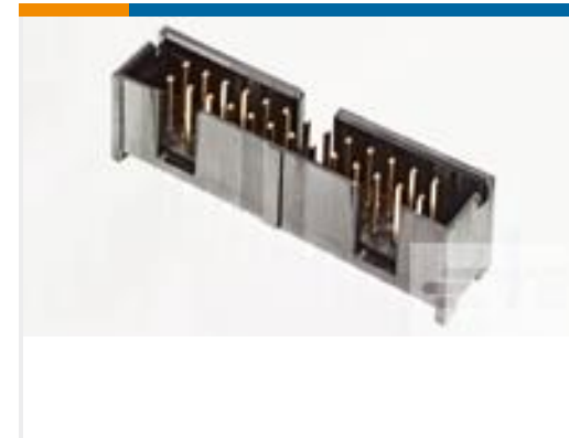
TE 产品编号2-1761603-9 IDC LOW PRO HDR 26P VERT BLUE