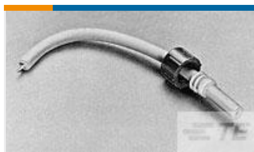
TE 产品编号1-830611-0 LGH 1/2 SNGL MLD END