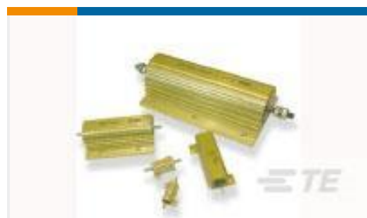
TE 产品编号9-1625971-5 HSA25 R01 10%