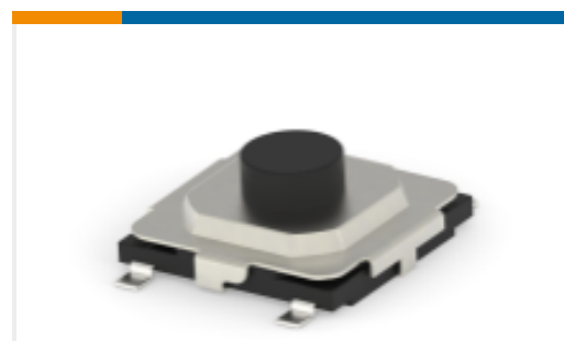
TE 产品编号2337238-3 TACT MINI GW 5.2X5.2X2 160GF