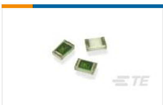
TE 产品编号1614349-9 RN 0603 10K 0.1% 10PPM CUT LENGTH