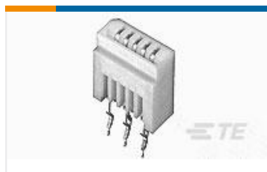
TE 产品编号84984-4 1mm FFC DIP V ASSY 4P NAT(TB)