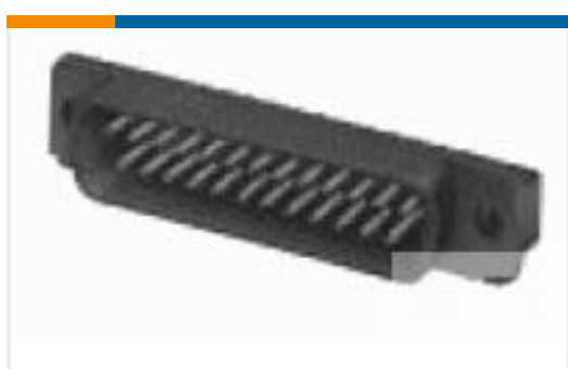
TE 产品编号745071-2 09 PLUG SP/AP SCRLK