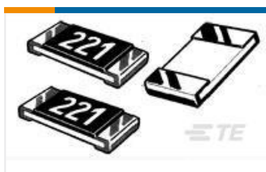
TE 产品编号3-2176231-5 3522 270R 1% 3W