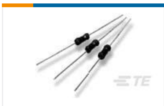
TE 产品编号2-1625885-3 1W SM M/OX 5% 150R