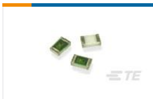
TE 产品编号4-1676971-2 RN 0805 200K 0.1% 10PPM 1K RL