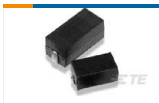
TE 产品编号2-1879234-0 SMF5 3K3 5%