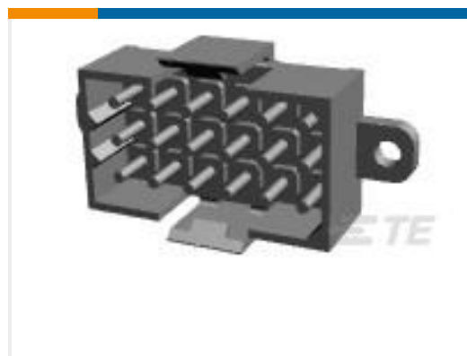
TE 产品编号207444-8 METRIMATE PIN HEADER ASSY,18P