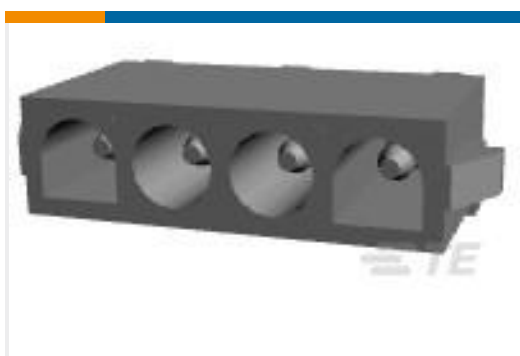
TE 产品编号350792-3 04P UMNL PIN HDR ASSY 94VO LF