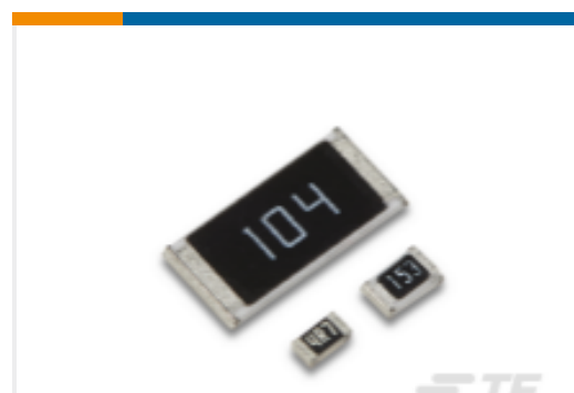
TE 产品编号2176349-9 CRGCQ 2512 47R 1%