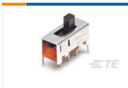
TE 产品编号1825267-1 MSS430004=4P3T SL SW AG