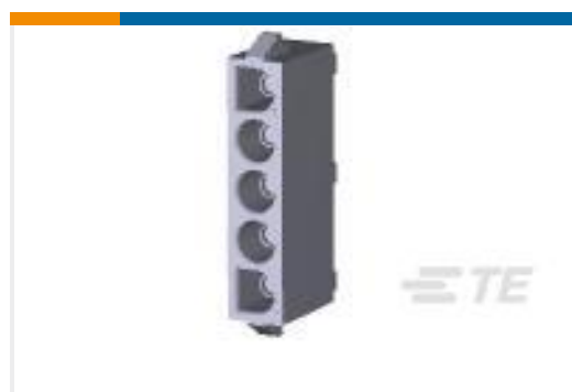
TE 产品编号640467-3 05P UMNL HDR ASSY LF