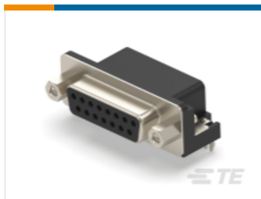
TE 产品编号2301845-2 AMPL REC HD20, R/A, 15P, B/L,4-40 A /LOCK