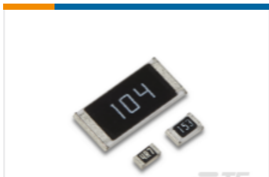
TE 产品编号3-2176349-0 CRGCQ 2512 2K7 1%