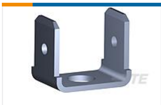
TE 产品编号41619 250 FASTON TAB BR