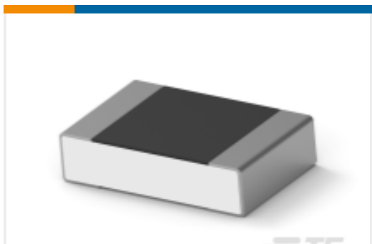
TE 产品编号3-2176379-1 RQ 0805 221R 0.1% 10PPM 5K RL