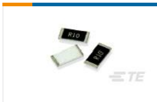
TE 产品编号1-2176052-6 RLP73N 1J R22 5% 5K RL