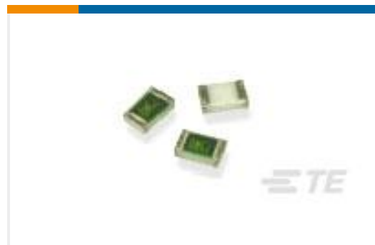
TE 产品编号6-2176088-4 RP 1J 0.166W 4K02 0.1% 25PPM 1K RL