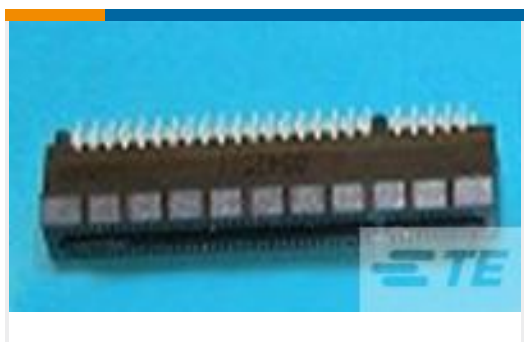
TE 产品编号5650118-2 CONN SEC II 10 POS 100C/L R/A