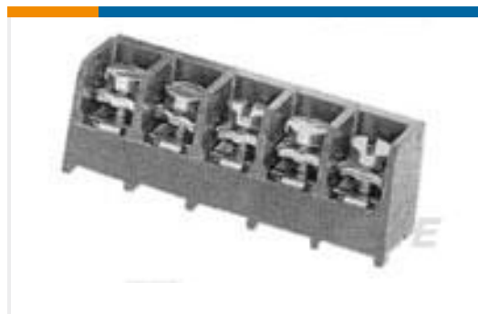
TE 产品编号6-1437652-8 6PCV-04-007=ASSEMBLY