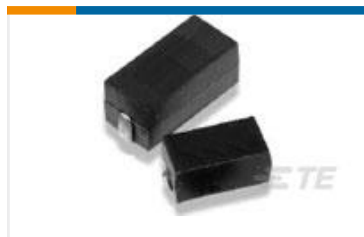
TE 产品编号1-1879234-2 SMF5 1K5 5%