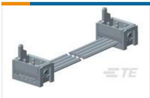
TE 产品编号1483350-2 MICRO-MATCH LEAD 04P 150MM