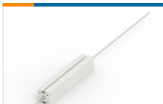
TE 产品编号1-1623730-4 线绕电阻器：垂直安装