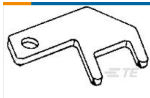
TE 产品编号725996-2 110 FASTON TAB TPBR