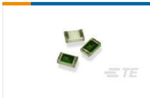
TE 产品编号9-1879208-6 CPF 0402 91K 0.1% 25PPM 1K RL