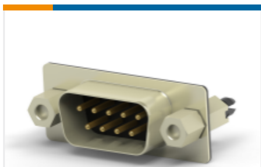
TE 产品编号2301826-2 AMPL PLUG HD20, VERT, 9P, B/L,4-40 S/LOC