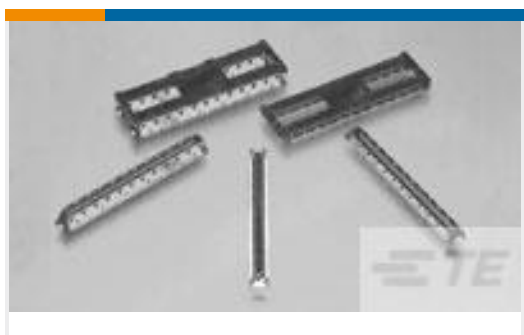
TE 产品编号3-5353652-6 .5FHFP08H,440,B,GIG,08/Sn,HT,NSYes