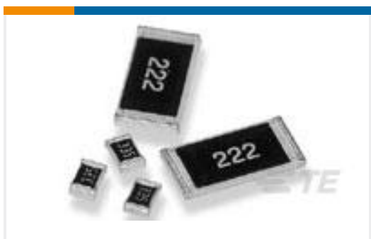
TE 产品编号1623693-1 CRG1206 ZEROHM