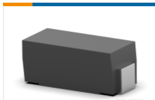
TE 产品编号5-2176459-3 SMW 7W 15R 5% Taped