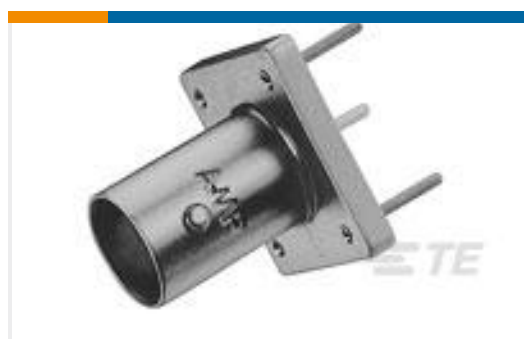
TE 产品编号1-1337445-0 BNC Str PCB Skt 50Ohm Silver P