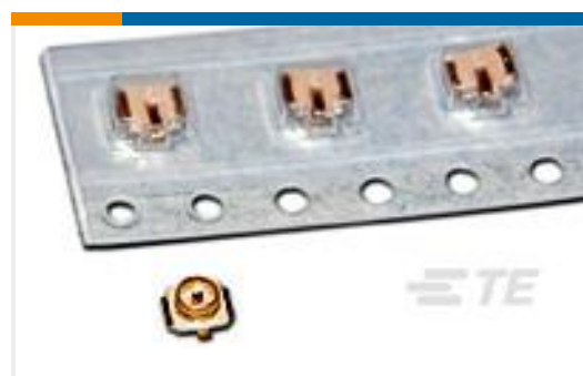
TE 产品编号1909763-1 UMCC MICRO-COAX RECPT GEN 1 HIGHER LEVEL