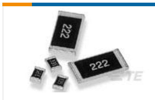
TE 产品编号1623401-1 CRG0805 ZEROHM