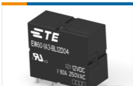
TE 产品编号2071366-1 EW60-1A3-BL12D04,00000